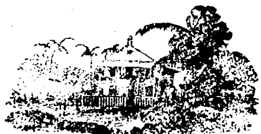
Sítio á venda

De 1° e 2° qualidade, americano e marca azul, vende-se na saboaria á vapor de 500 reis á 560 reis o kilo, com tara de 2 1/2 kilos em cada caixa.